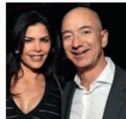
AMAZON-CHEF JEFF BEZOS Diese Frau kostet ihn Milliarden