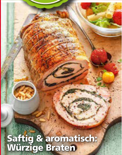
Saftig & aromatisch: Würzige Braten

Leicht & lecker Herzhaftes mit und ohne Fleisch, Desserts & Kuchen