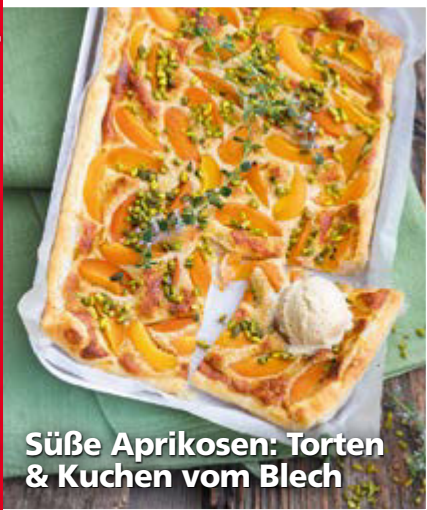
Süße Aprikosen: Torten & Kuchen vom Blech