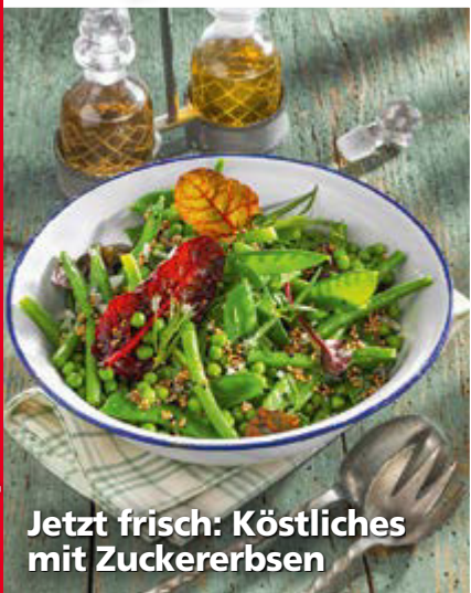
Jetzt frisch: Köstliches mit Zuckerböbse