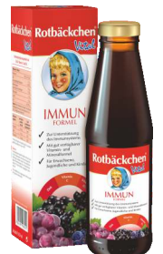
ROTBÄCKCHEN Vital Immun Formel (mit Zink, Vitamin C + D)