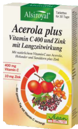
ALSIROYAL® Acerola plus Vitamin C 400 und Zink für Langzeitwirkung