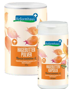
REFORMHAUS® PLUS Hagebuttenpulver Hagebuttenkapseln