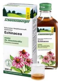
SCHOENENBERGER® Echinacea Naturreiner Heilpflanzensaft