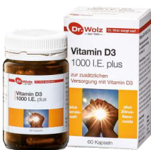
DR. WOLZ Vitamin D3 1000 I.E. plus