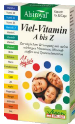
ALSIROYAL® Viel-Vitamin A bis Z