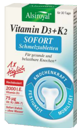
ALSIROYAL® Vitamin D3+K2 SOFORT Schmelztabletten