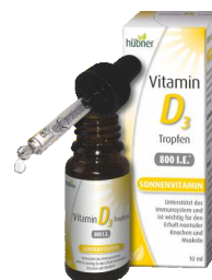
HÜBNER Vitamin D3 Tropfen