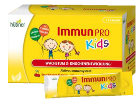
HÜBNER ImmunPRO Kids