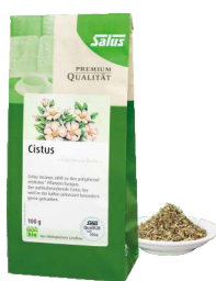
SALUS® Cistus Tee