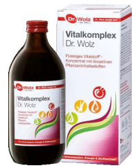
DR. WOLZ Vitalkomplex