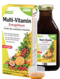
SALUS® Multi-Vitamin Energetikum