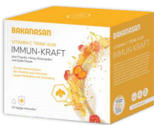
BAKANASAN Immun-Kraft Vitamin C Trink-Kur