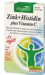
ALSIROYAL® Zink+Histidin plus Vitamin C