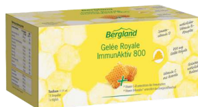
BERGLAND Gelee Royal ImmunAktiv 800